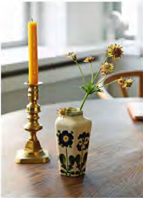
Arvestykker og nøje udvalgte loppesfund bruges som små stemningsspredere. Messingstagen og den lille vase har Dorte arvet fra sine forældre.