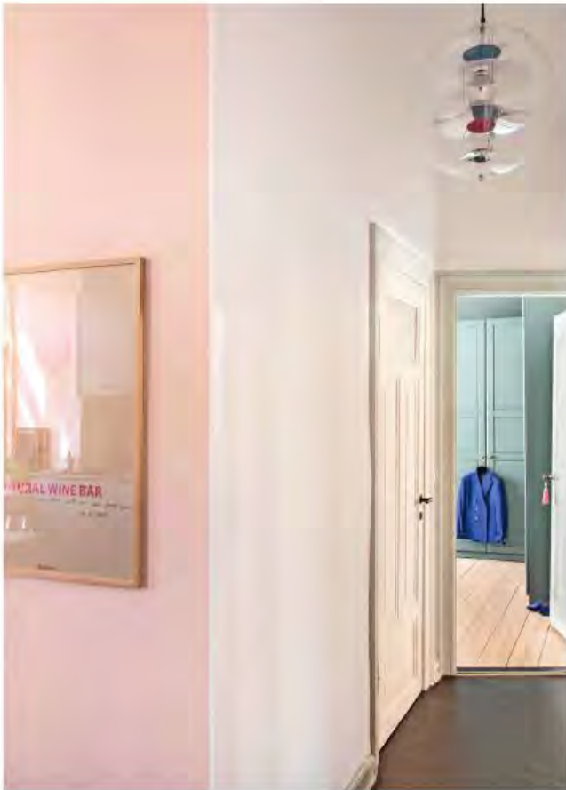
Farverne udnyttes til fulde i gangen, hvor det sorte linoleumsgulv, de lyserøde vægge og de kulørte detaljer i VP-Globe-lampen spilles ud mod hinanden.