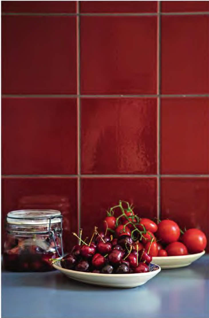
Bordpladens kølige blå farve står i smuk kontrast til de vinrøde fliser. Dorte havde egentlig forestillet sig rosa klinker over køkkenbordet, men hun lod sig overtale, og det er hun glad for i dag.